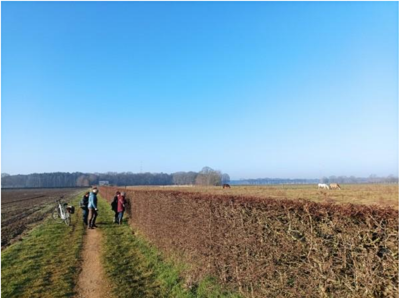
Door de haag was blijkbaar van alles te zien!